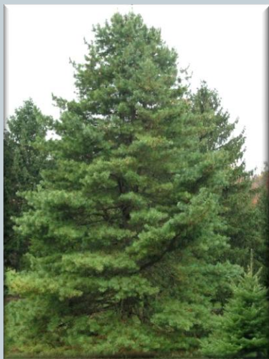
Pinus koraiensis (Korea, China)