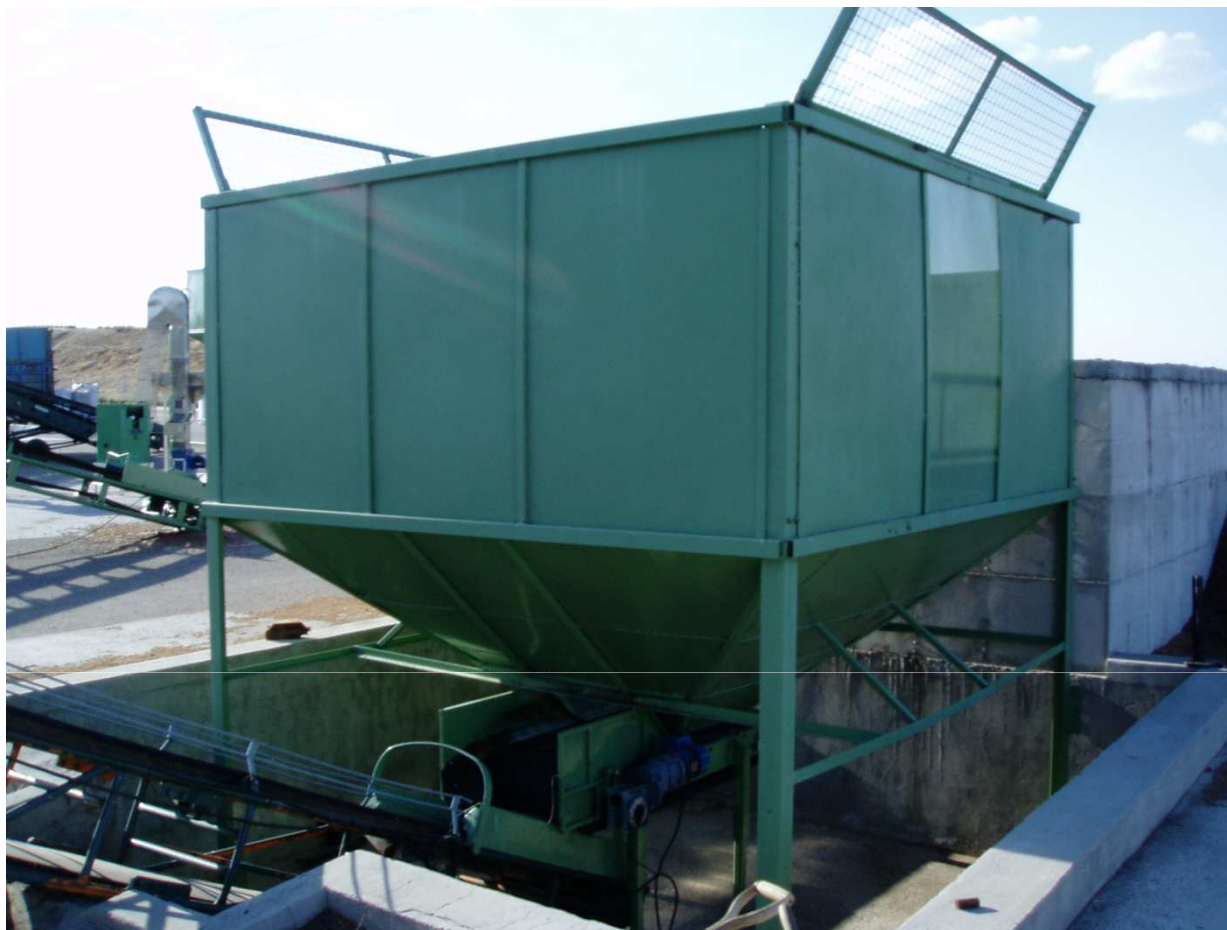
Tremonha de recepção