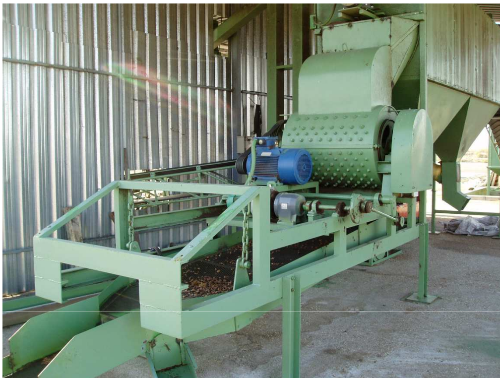
Triturador acoplado a tarara