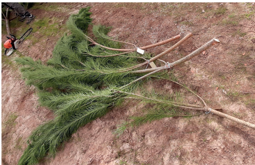
Figura 2 – Aspectos da separação, medição e pesagem de diferentes órgãos do pinheiro-mansinho.